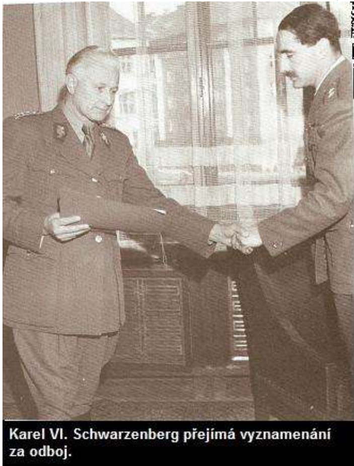
Karel VI. Schwarzenberg přejímá vyznamenání za odboj.